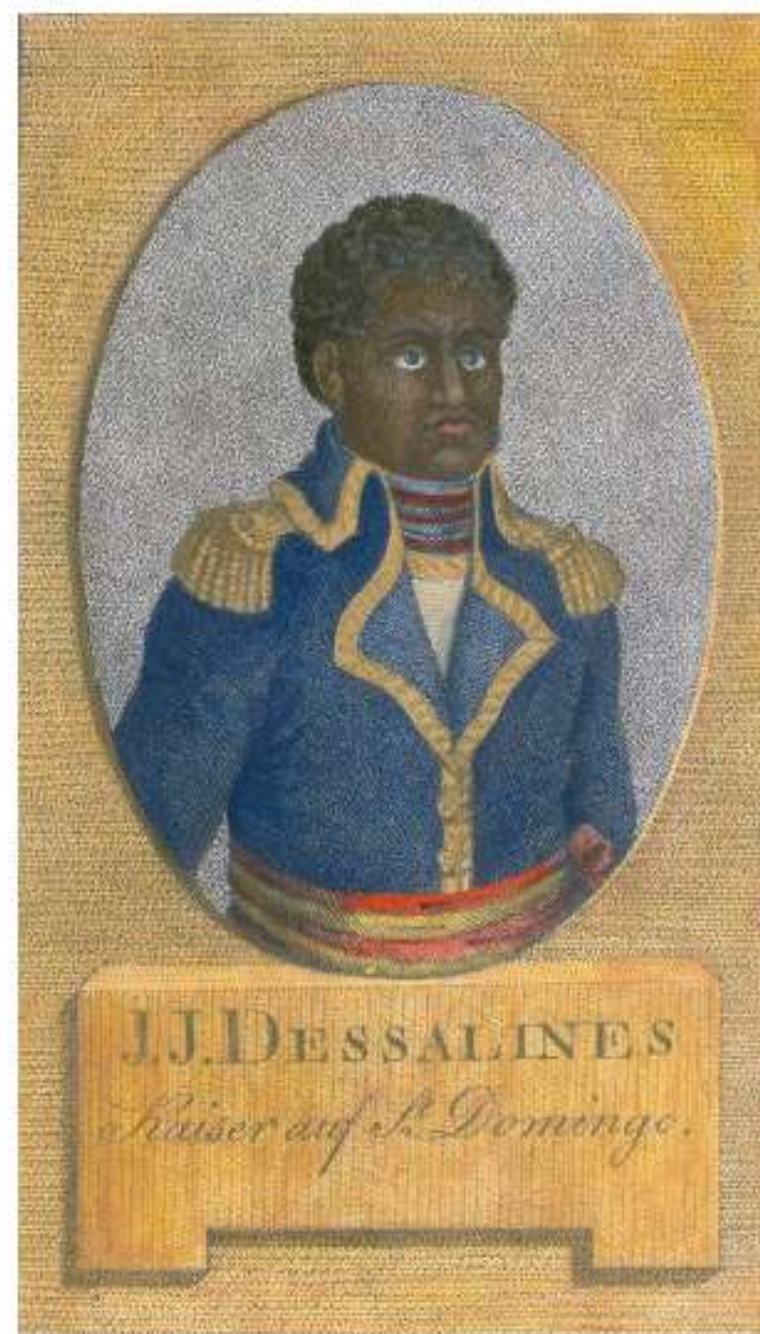
Jean-Jacques Dessalines assumiu a liderança da Revolução após a prisão e morte de Toussaint Louverture