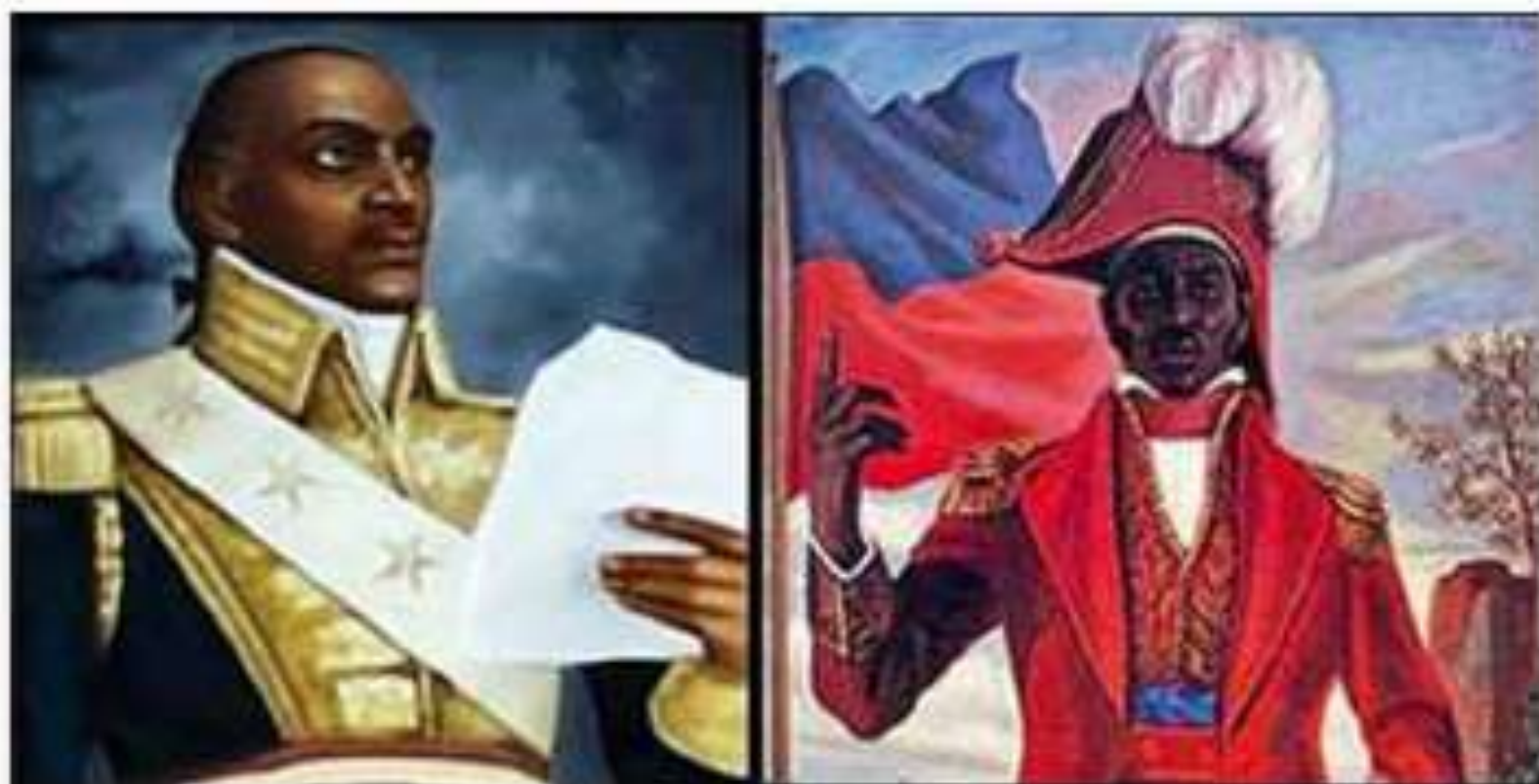
Toussaint Louverture e Jean Jacques Dessalines, líderes da Independência do Haiti