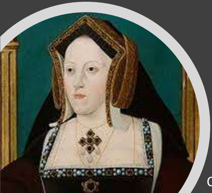
Catarina de Aragão