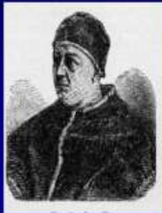
Papa Leão X