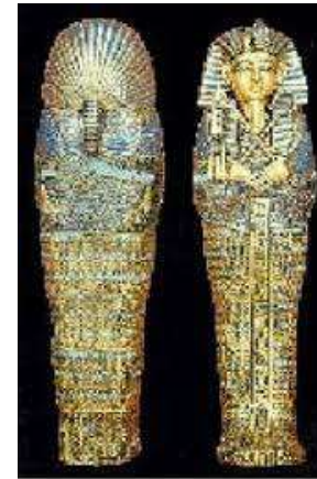
Sarcófago para as víceras, Novo Império, Museu Egípcio, Cairo