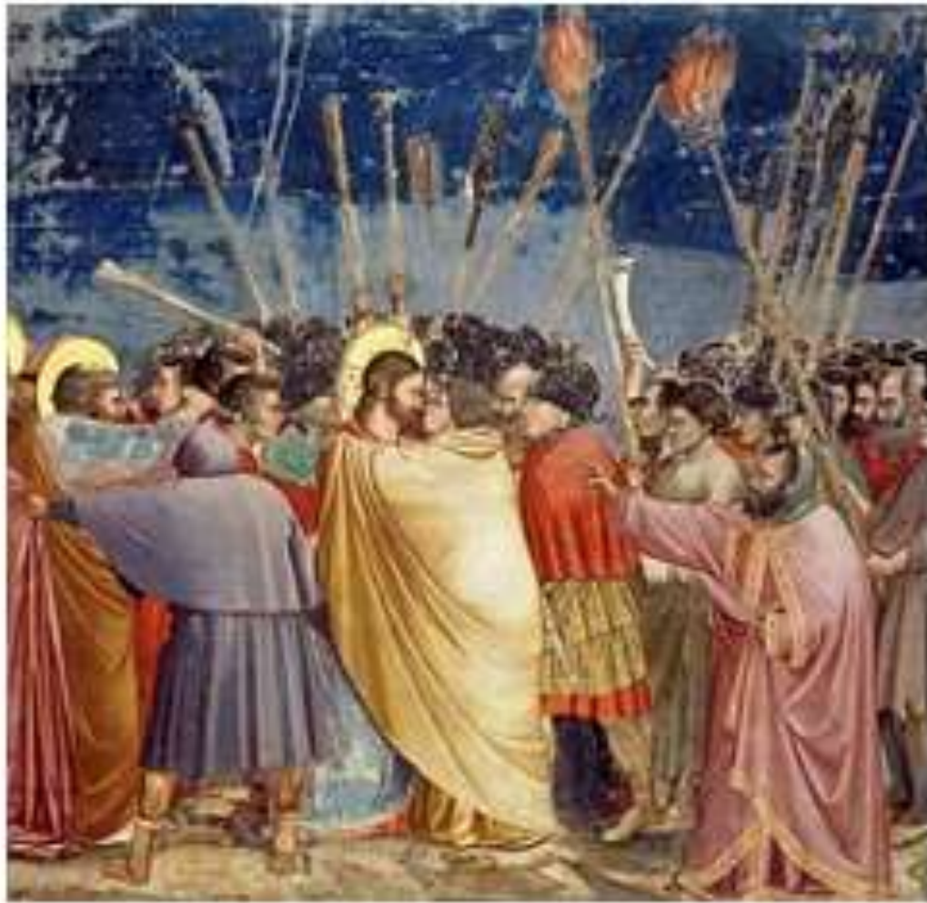
O Beijo de Judas (entre 1304 e 1306): uma das obras mais conhecidas de Giotto.