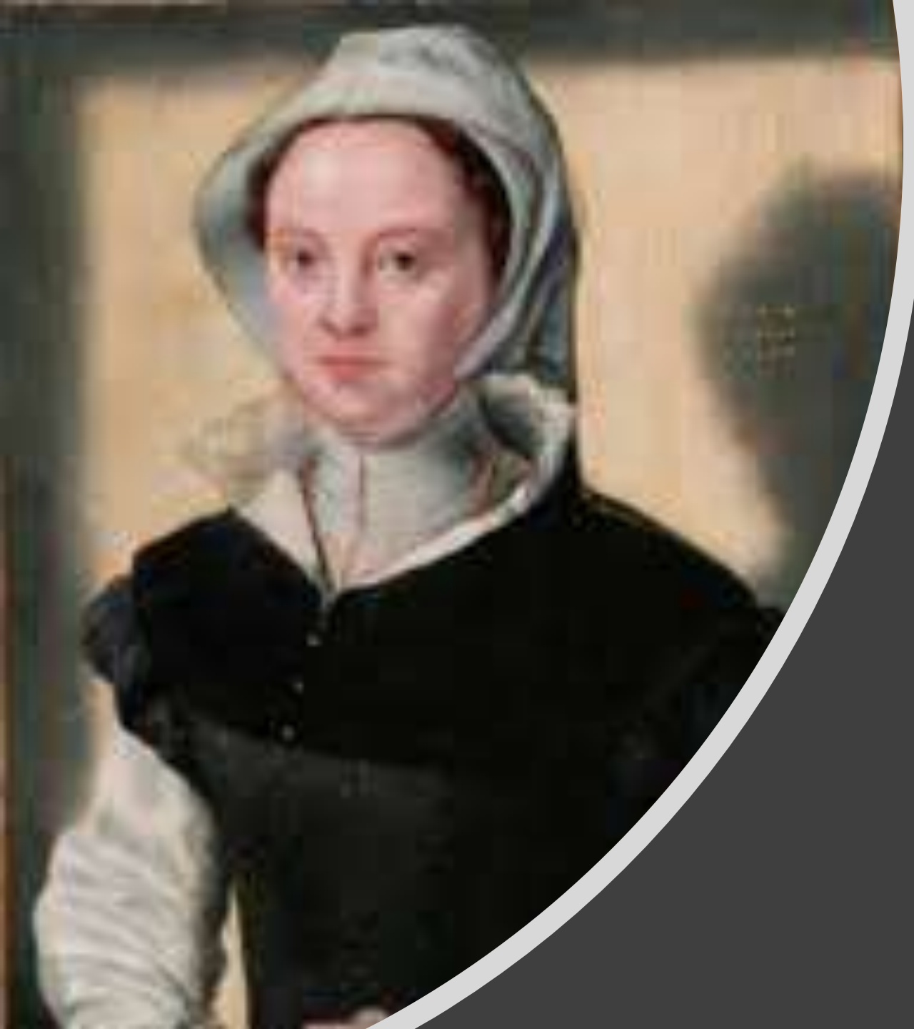
Caterina van Hemessen